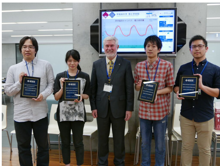
SB 設立 5 周年記念表彰：奈良先端科学技術大学院大学、東京都市大学、名古屋大学、東京電機大学（懇親会にてハワード会長と記念撮影）