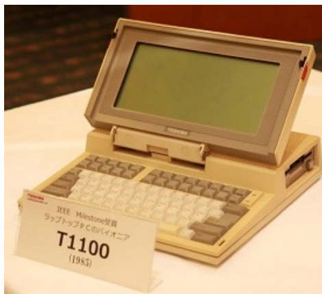
ラップトップ PC T1100

The Toshiba T1100, an IBM PC compatible laptop computer that shipped in 1985, made an invaluable contribution to the development of the laptop PC and portable personal computers. With the T1100, Toshiba demonstrated and promoted the emergence and importance of true portability for PCs running packaged software, with the result that T1100 won acceptance not only among PC experts but by the business community.