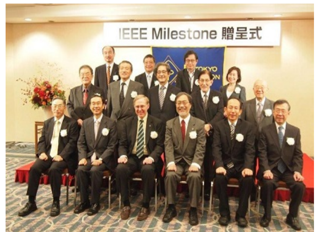
贈呈式 IEEE 側の招待者と関係者