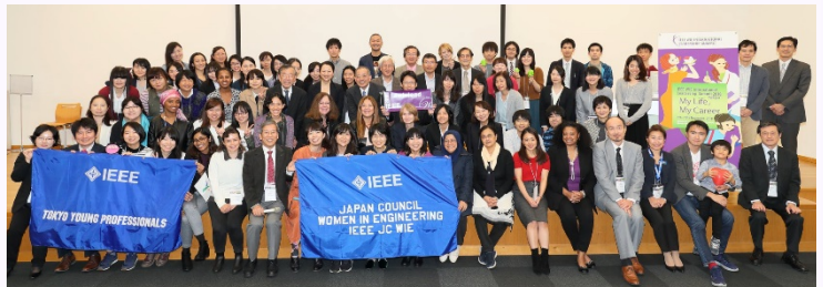
WIE ILS 2018 Tokyo