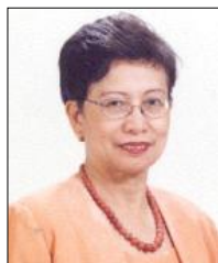
Secretary, Department of Science and Technology (科学技術省大臣)