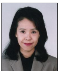
東京工業大学 学術国際情報センター 教授

申込方法： 下記 Web サイトよりお申し込みください。 なお APEC WLN 会合の参加には 4 万円の参加費が必要となります。 http://www.apecwln2010.jp/ja.html