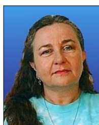
Associate Professor, Universidad Católica del Norte