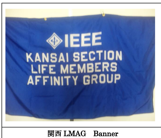
関西 LMAG Banner